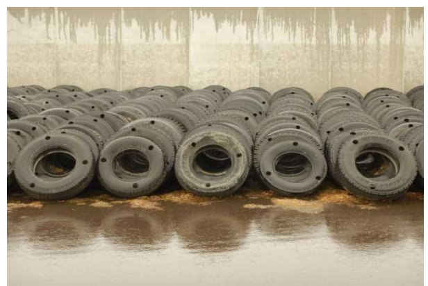
写真1 整理整頓されたサイロ周辺のタイヤ