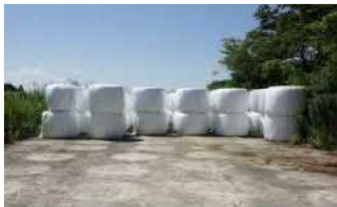
写真2 ロールベールの縦積み保管、越冬前に破損の点検を