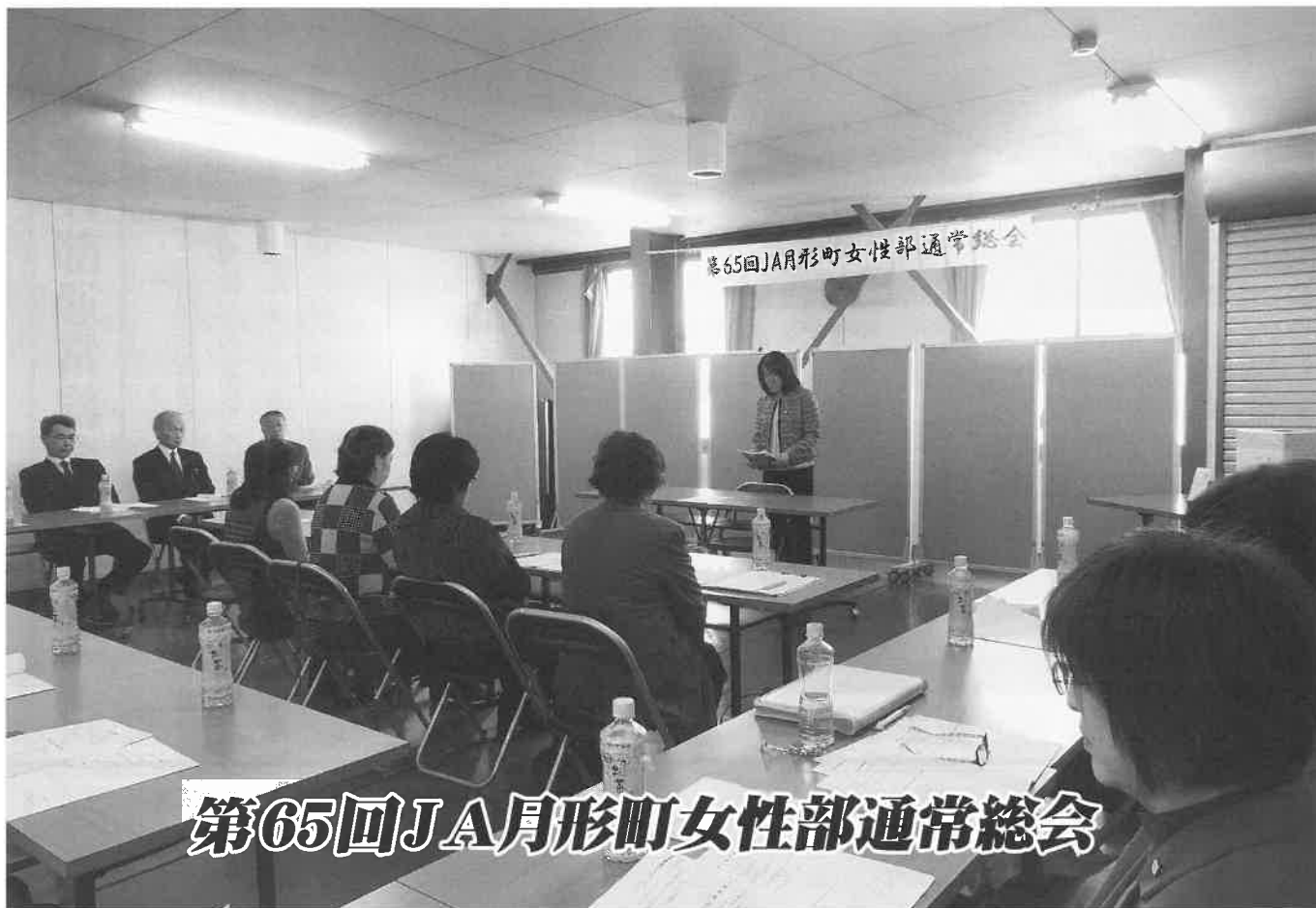
第65回JA月形町女性部通常総会