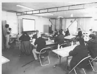
★2月12日 月形蔬菜生産組合 栽培講習会

JA月形町青年部は15日、月形町札比内果菜集出荷場前にてスノーメッセージを作った。青年部活動の一環として、農業者の思いを消費者にPRするのが目的。部員11名が参加し、高さ4m・幅7mの雪山に「Jump!!」とメッセージを描いた。