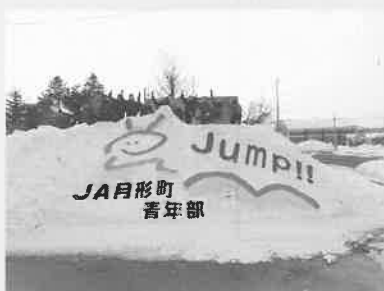
★2月15日 青年部 スノーメッセージ作成

JA月形町青年部は15日、月形町札比内果菜集出荷場前にてスノーメッセージを作った。青年部活動の一環として、農業者の思いを消費者にPRするのが目的。部員11名が参加し、高さ4m・幅7mの雪山に「Jump!!」とメッセージを描いた。