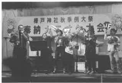
越谷・久保・木下職員

二十六日には樺戸神社秋季例大祭奉納カラオケ大会が開催され、JA月形町から新人8名が参加しました。