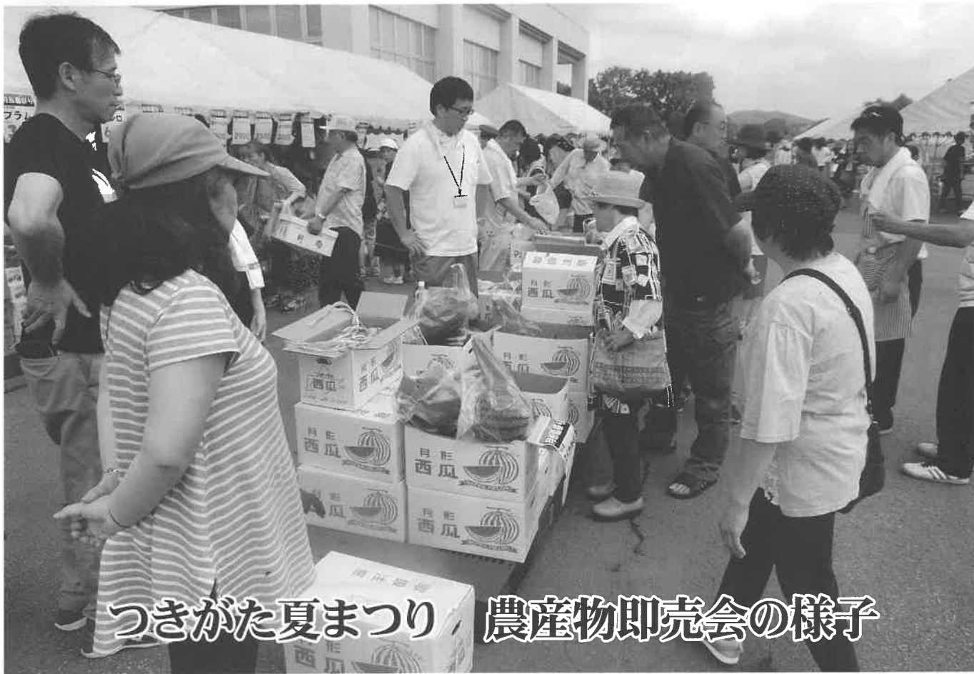
つきがた夏まつり 農産物即売会の様子