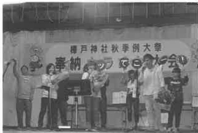
佐々木・小中谷・堂前職員