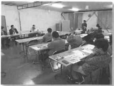
3月25日 月形花き生産組合 切り花講習会