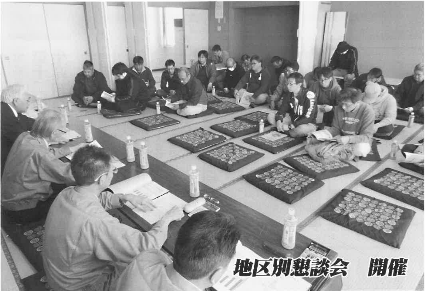
地区別懇談会 開催