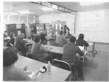
3月4日 ミニトマト生産組合 栽培講習会