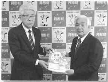
3月20日 JAバンク食農教育教材、月形町教育委員会へ贈呈