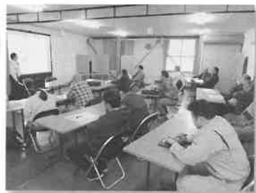
3月12日 「ゆめぴりか」生産部会 全体会議及び栽培講習会