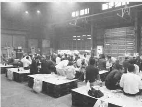
■六月二十二日 月形蔬菜生産組合が流通懇 談会を開催し、多くの生産者、 市場関係者が参加しました。