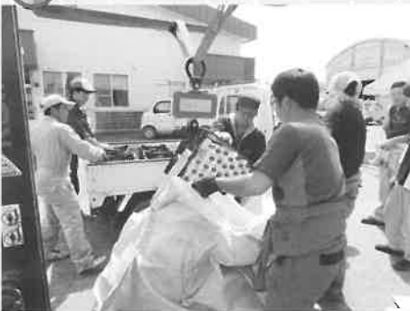
■六月二十二日 月形町農協青年部が資材店 舗前で農業容器の回収を実施 しました。