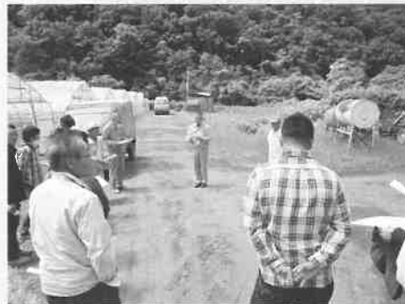
■六月十五日 月形ミニトマト生産組合が町 外視察研修で余市町を訪問 し、生産ほ場や選果施設を視 察しました。