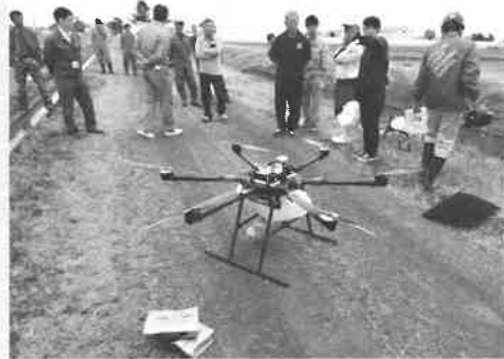
■六月八日 （有）フューチャリーのほ場で、 農業用ドローンのデモフラ イトが行われました。