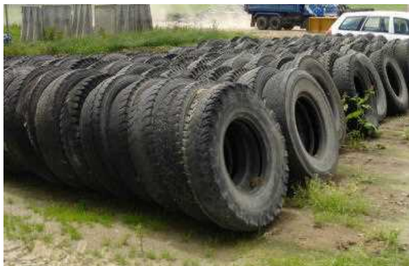
整理整頓されたサイロ周辺のタイヤ