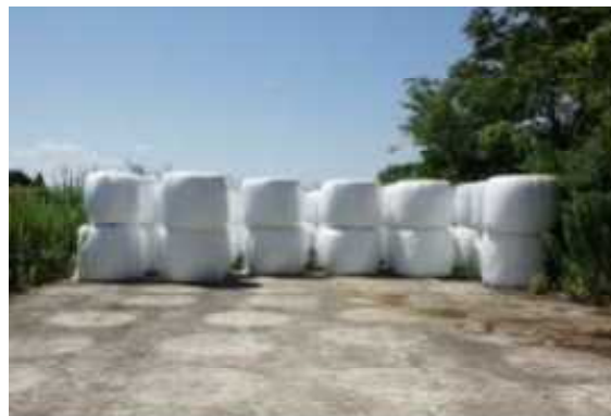
ロールベールの縦積み保管、越冬前に破損の点検を